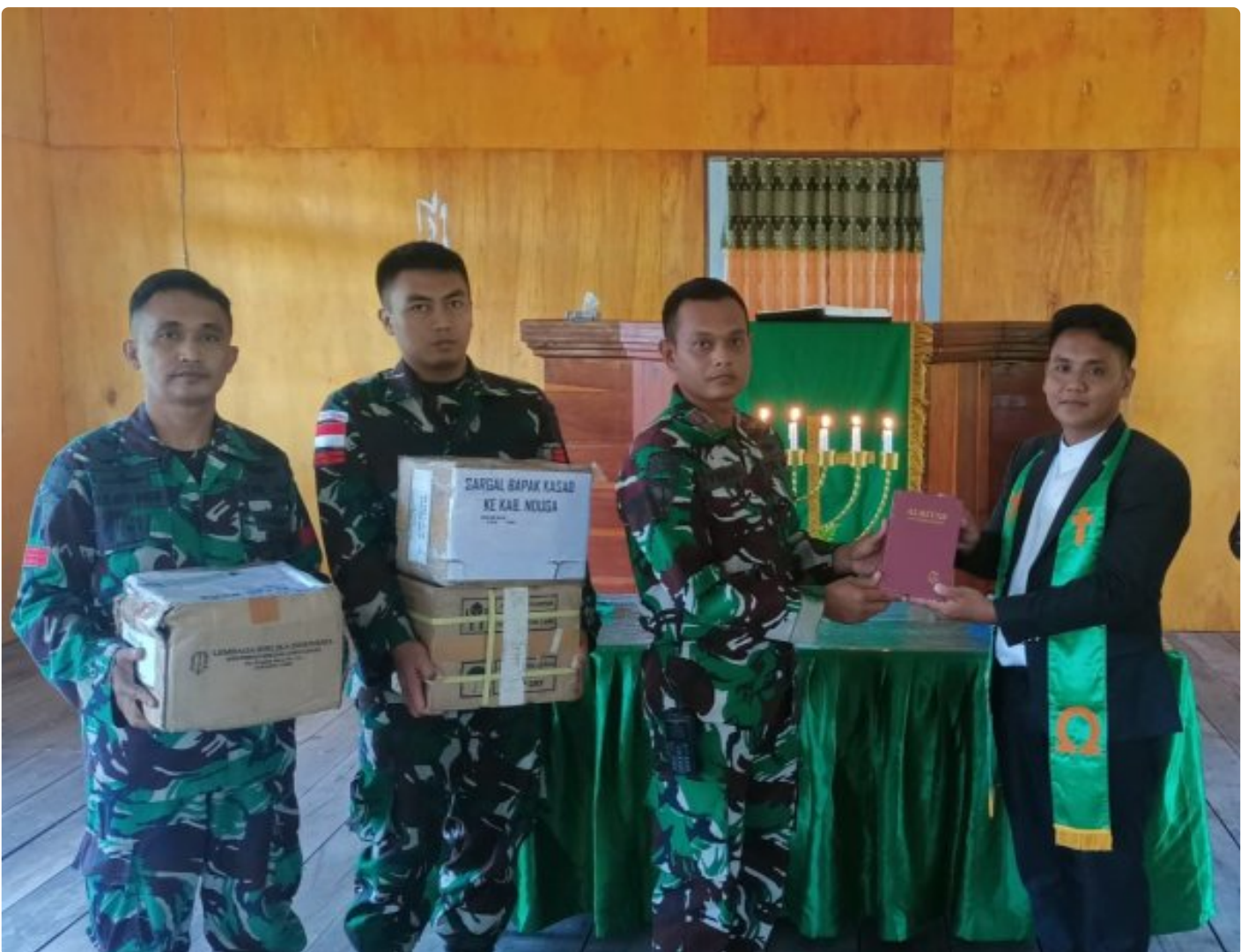
Foto: Satgas Yonif 503/Mayangkara kembali menunjukkan dedikasinya kepada masyarakat di Papua dengan memberikan dukungan alat musik untuk kegiatan ibadah di Gereja GKI Bethesda Batas Batu, Distrik Krepkuri, Kabupaten Nduga. Pada Minggu, 12 Januari 2025.

NDUGA- Satgas Yonif 503/Mayangkara kembali menunjukkan dedikasinya kepada masyarakat di Papua dengan memberikan dukungan alat musik untuk